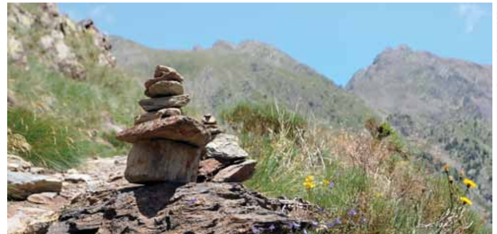
Un cairn sur le chemin des Ingénieurs.