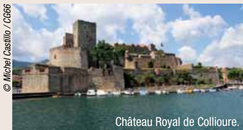
Château Royal de Collioure.