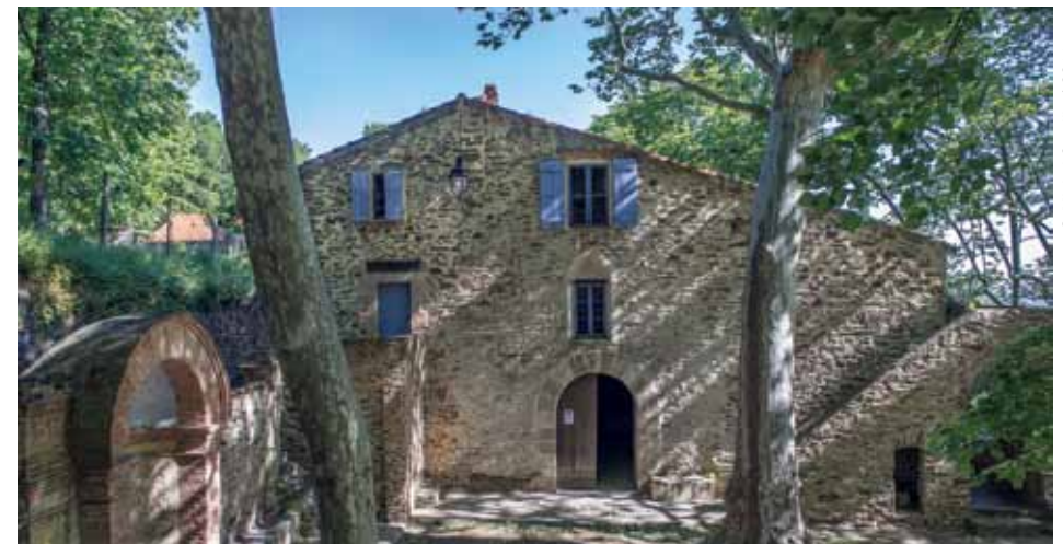
Sur le chemin, l'ermitage de Notre-Dame-de-Consolation.

Rejoignez-nous et randonnez l'esprit libre