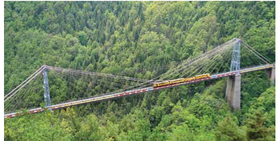
Le pont Gislard.