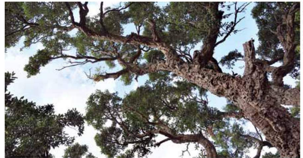
Les chênes-lièges jalonnent le parcours.