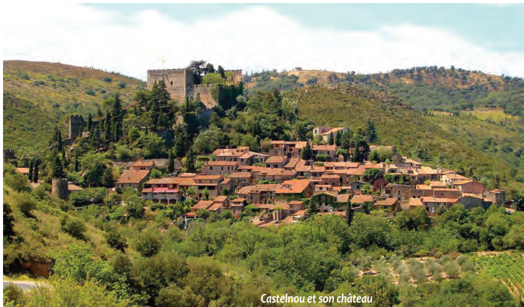
Castelnou et son château

Dans ce département où chaque pierre a une histoire, il est plus que jamais essentiel que chacun puisse en être le visiteur, le témoin, l'acteur.