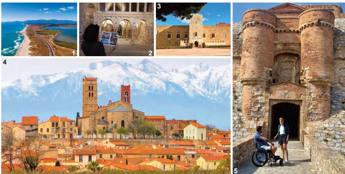
1: Plage de Saint-Cyprien - 2 : Prieuré de Serrabone - 3 : Palais des Rois de Majorque - 4 : Cathédrale d'Elne - 5 : Forteresse de Salses

En collaboration étroite avec des associations locales, comme Le Volant Salanquais - section handisport -, l'ADT mène des évaluations rigoureuses des sites touristiques. Une démarche humaine et inclusive, qui renforce la lisibilité et l'impact du label auprès du grand public.