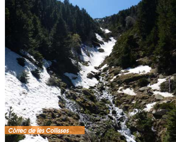
Còrrec de les Collisses

⑤ Du Ras dels Cortalets, empruntez l'itinéraire balisé en rouge et blanc qui correspond au GR®10, GR®36 et GR®T83 pour rejoindre le refuge d'où vous pouvez atteindre le sommet du Canigó. Comptez environ entre 1 h 30 et 2 h de marche.