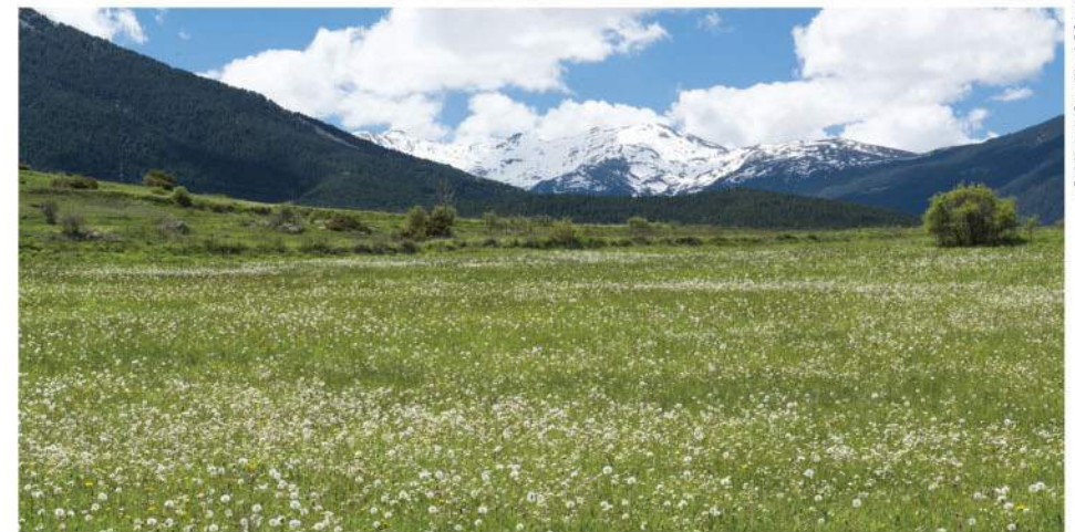
Sur le parcours.