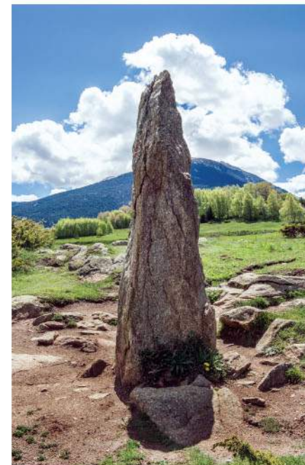
Le menhir d'Eyne.

6 Bifurquer à droite pour contourner la butte du Pla del Bac et arriver au relais TV. Descendre par le sentier et regagner Eyne.