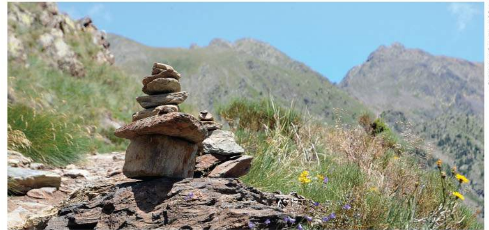
Un cairn sur le chemin des Ingénieurs.