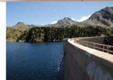
Le barrage du Lanoux.

1 Du parking, emprunter le sentier qui démarre entre les deux panneaux d'information. Au premier croisement, laisser le sentier à droite pour suivre l'itinéraire qui escalade en pleine pente le versant. Il débouche sur un chemin transversal balisé blanc-rouge.