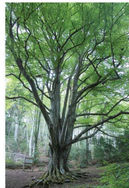
Le Fajas d'en Baillette