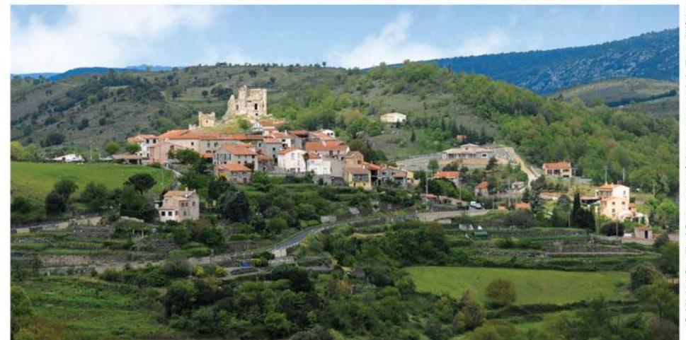
Le village du Vivier

FENOUILLEDES Sud Cathare Entre Pyrénées et Méditerranée