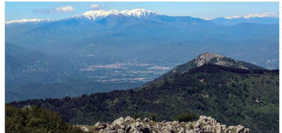
Vue sur le Canigó depuis le sommet du Puig Neulós.