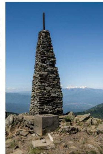
La borne frontière au sommet du Puig Neulós.

5 Redescendre par le même chemin qu'à l'aller.