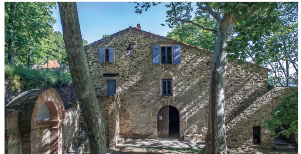
Sur le chemin, l'ermitage de Notre-Dame-de-Consolation.