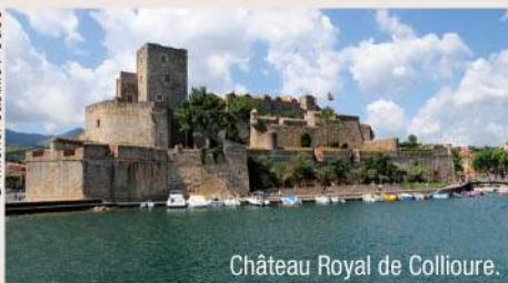
Château Royal de Collioure.