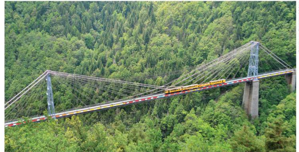
Le pont Gisclard.