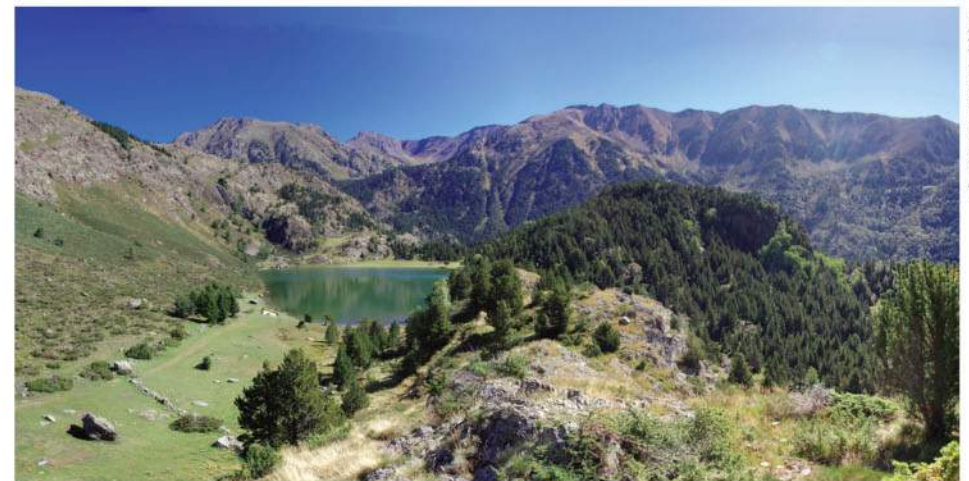
L'étang et la vallée