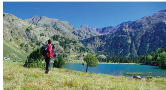
L'étang de Font Vive

7 La suivre à droite, franchir une passerelle et rejoindre le départ du télébenne EDF et le parking.