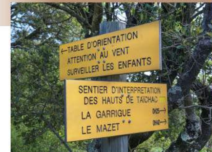
La signalétique de l'itinéraire

Pensez à réserver ! Retrouvez toutes les offres sur www.tourisme-pyreneesorientales.com Rubrique « organiser votre séjour » - « Où dormir ? » Informations réservations meublés de tourisme : Gîtes de France des Pyrénées-Orientales 33 (0)4 68 68 42 88 www.gites-de-france-66.com Clévacances des Pyrénées-Orientales 33 (0)4 68 51 52 53 www.tourisme-pyreneesorientales.com