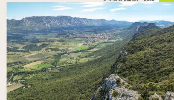
Le synclinal de St-Paul-de-Fenouillet vue depuis les crêtes

nantes falaises. Nous nous trouvons aussi sur l'épicentre des séismes nord-pyrénéens, les dernières fortes secousses datent de 1996 et 2004.